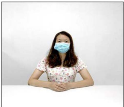
图2：正前方第一机位效果图